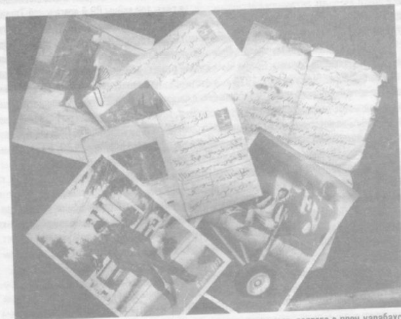
Письма на дари и фотографии, изъятые у афганского моджахеда, взятого в плен карабахскими солдатами