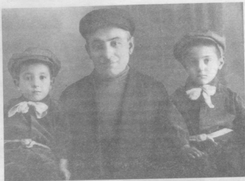
Отец и сыновья – жители села Гиши Варандского (позднее Мартунинского) района АОНК.