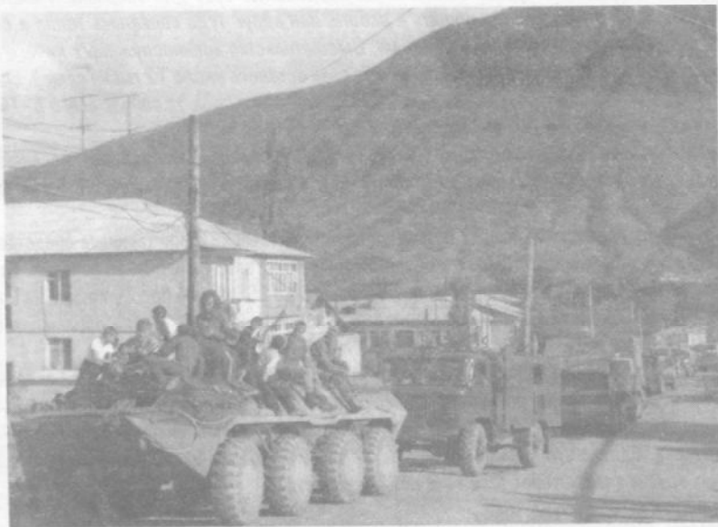
Из Шаумяна – с картошкой. Только в сопровождении БТРов могла пройти колонна грузовиков с картофелем для НКАО осенью 1989 года.

В этих условиях основным грузовым транспортным средством для ввоза и вывоза грузов стали в НКАО большегрузные вертолеты МИ-26. Предоставляемые военным командованием дислоцированной в Армении 7-й Гвардейской армии, они доставляли по воздуху в НКАО товары первой необходимости, прежде всего продовольственные: муку, сахар и т.п.