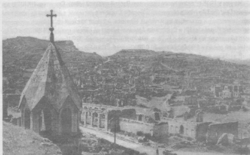
Развалины армянской части Шуши. Сорок тысяч мертвых окон. Снимок сделан в 1946 году