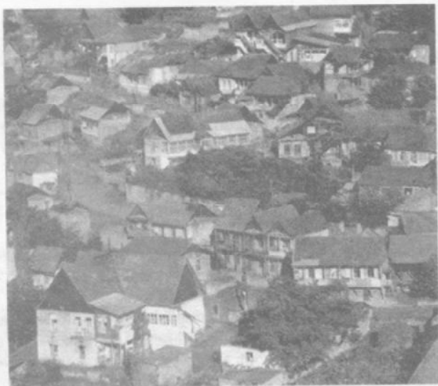
Вид на центральную часть села Геташен, Северный Арцах.