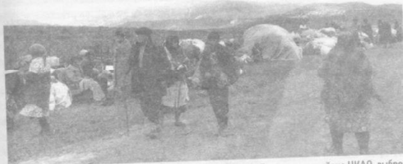
Операция «Кольцо». Депортированные жители одного из сел Гадрутского района НКАО, выброшенные в поле на административной границе между АзССР и АрмССР.

Также очевидно, что события апреля-июня были лишь прелюдией к широкомасштабной депортации всей оставшейся армянской части Нагорного Карабаха.