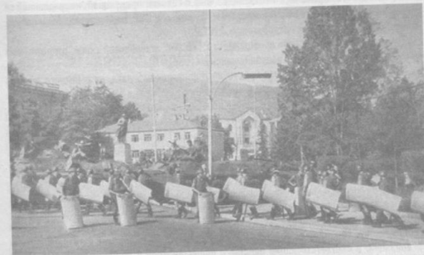
Чрезвычайное положение. Центр Степанакерта: солдаты охраняют от народа здание обкома партии, превращенное в резиденцию Оргкомитета и военной комендатуры.