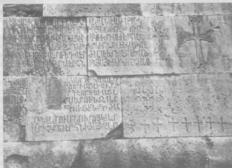
Армянских надписей на стенах Гандзасара насчитывается до 180-и. По мнению бакинских «ученых», армяне сделали их в XIX веке, предварительно «сбив молоточками албанские надписи».