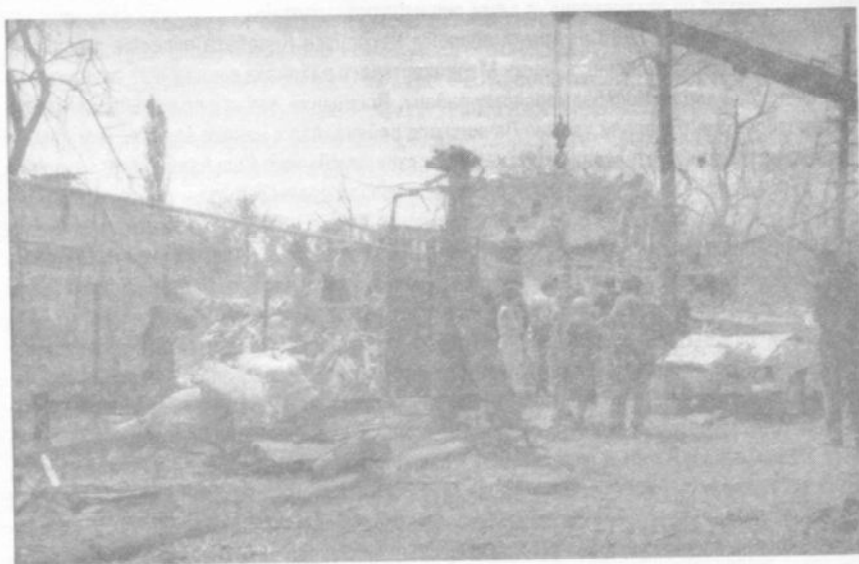
Степанакерт, август 1992 г. После налета самолетов азербайджанской авиации, пилотируемых летчиками-наемниками. Эвакуация погибшего и разбор завалов.

инициативы. На сей счет есть документы. Не случайно Совет Безопасности ООН как раз после срыва прекращения огня Азербайджаном в октябре 1993 г. и всех 4-х резолюций по Карабаху перестал принимать их... Баку пошел на перемирие не из-за резолюций, а перед угрозой полного коллапса. Ранее там никак не шли на примирение, а в мае 1994 г. вдруг стали сами торопить с этим» 1 .