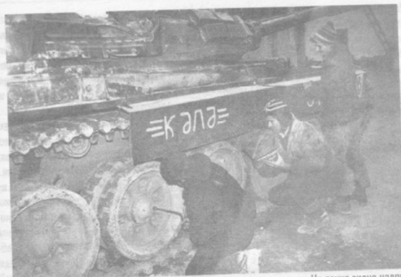
Ремонт трофейного танка на степанакертском заводе сельхозтехники. На танке видна надпись на азербайджанском «кала» – крепость.