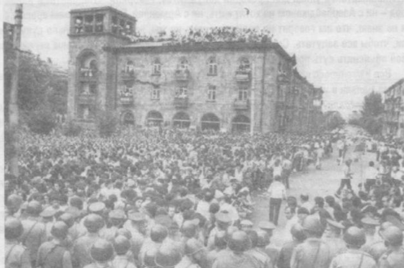
Митинг в Ереване в связи с карабахскими событиями. Лето 1988 года