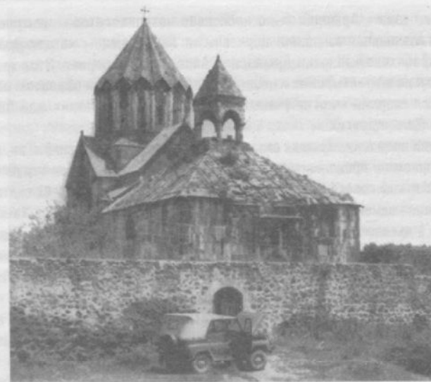
Храм Гандзасар (Мардакертский район АОНК–НКАО), по определению А. Якобсона, – «энциклопедия армянской архитектуры». 1988 год

Храм Гандзасар, построенный в XIII веке на вершине высокой горы близ села Ванк (ныне Мардакертский район Нагорно-Карабахской Республики), стал на несколько веков резиденцией карабахского католикосата.