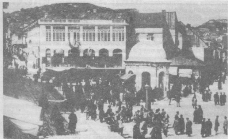
Центральная площадь Шуши. На среднем плане – здание городской управы