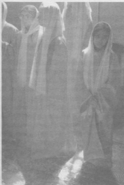
Во время службы в главном храме Шуши; церковный хор.