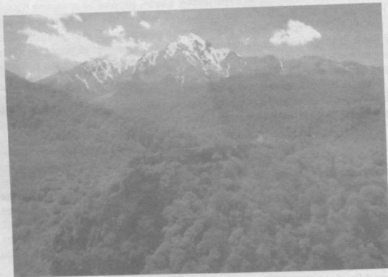
Вид на горный хребет Мрав, делящий Нагорный Карабах на центральную и северную части. На переднем плане – урочище и крепость Гюлистан. Здесь в 1813 году был подписан русско-персидский Гюлистанский договор, по которому Нагорный Карабах «на веки вечные» переходил в состав России.