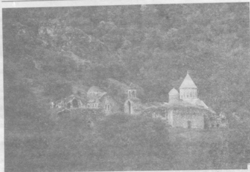
Монастырский комплекс Дадиванк в Ново-Шаумянском (бывшем Кельбаджарском) районе НКР.