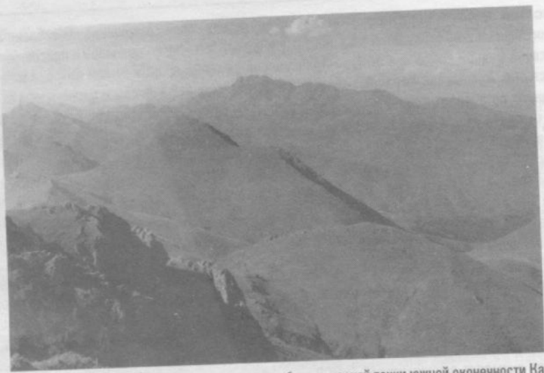
Вид на гору Большой Кирс (2724 м) с вершины наиболее высокой точки южной оконечности Карабахского хребта – горы Дизапайт (2478 м).