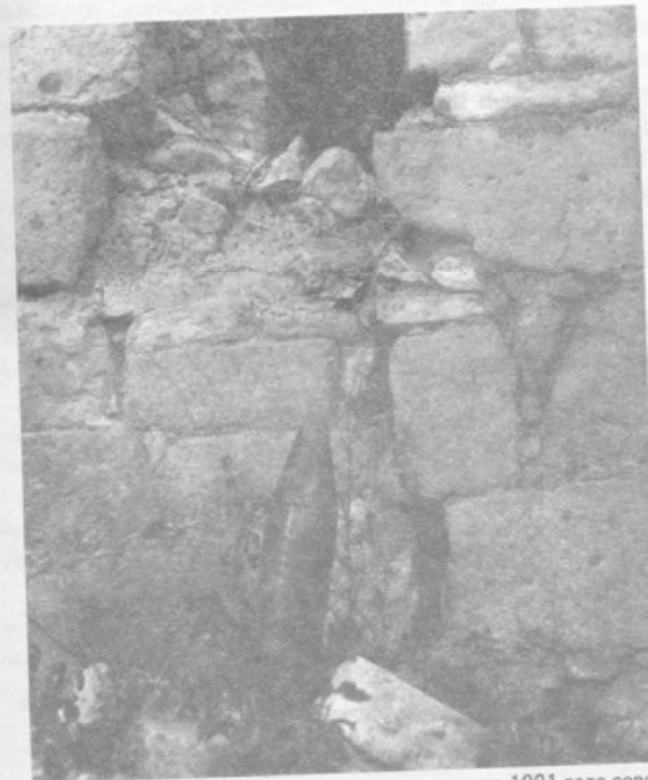
Операция «Кольцо». В конце июля — начале августа 1991 года село Вериншен Шаумянского района Нагорного Карабаха подверглось обстрелам со стороны Советской Армии. Неразорвавшийся 122-мм артиллерийский снаряд.