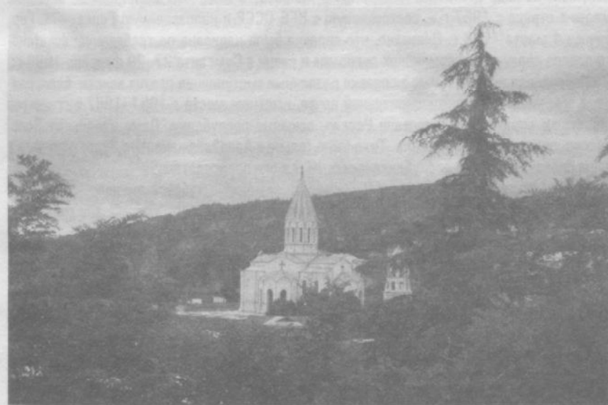
Шуша сегодня: вид на вновь отреставрированную церковь Сурб Аменапркич (Св. Всеспасителя).