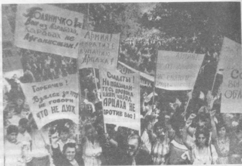
Степанакерт, лето 1990 года. Несанкционированный митинг протеста против террора и произвола со стороны Оргкомитета и военной комендатуры