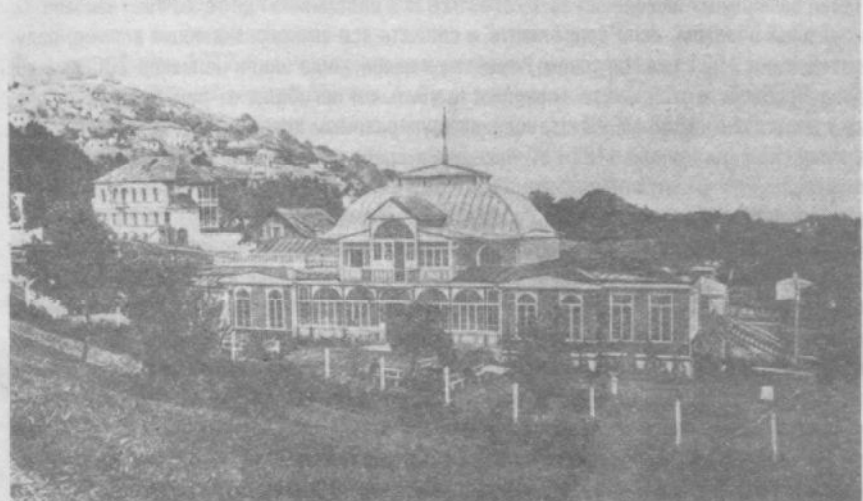
Здание летнего помещения общественного собрания Шуши